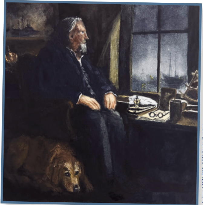
Autor: ITEN TSN-ARQ Paulo Guedes