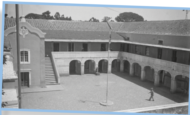
Serviço e Escola prática de Torpedos e Eletricidade