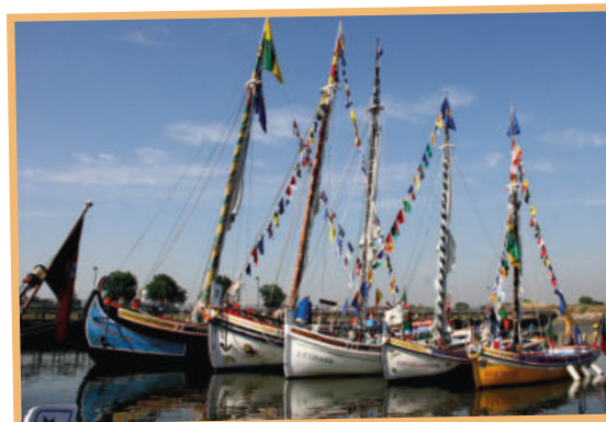
Barcos engalanados na festa da Moita