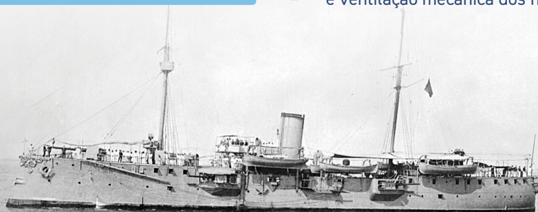
Cruzador S. Gabriel