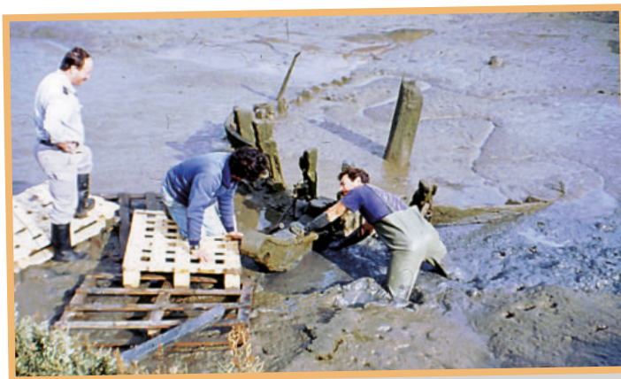
Levantamento e localização dos mastros e das medidas de um iate enterrado no lodo, que estiveram na origem dos desenhos do Hiate de Setúbal