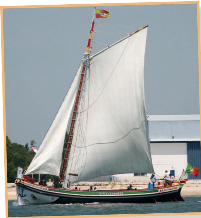
Bote Leão, da Câmara Municipal de Alcochete