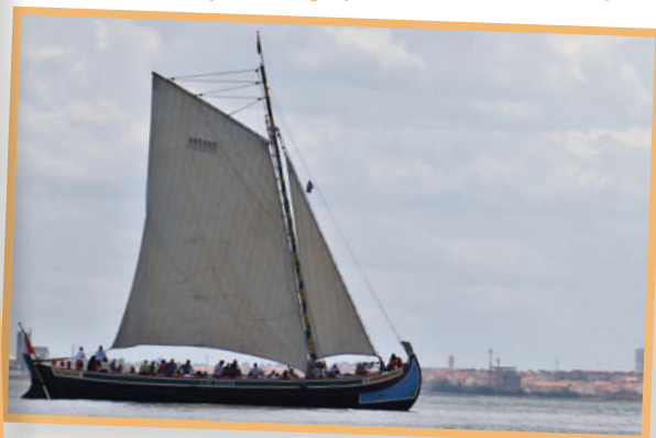
Varino Boa Viagem, da Câmara Municipal da Moita