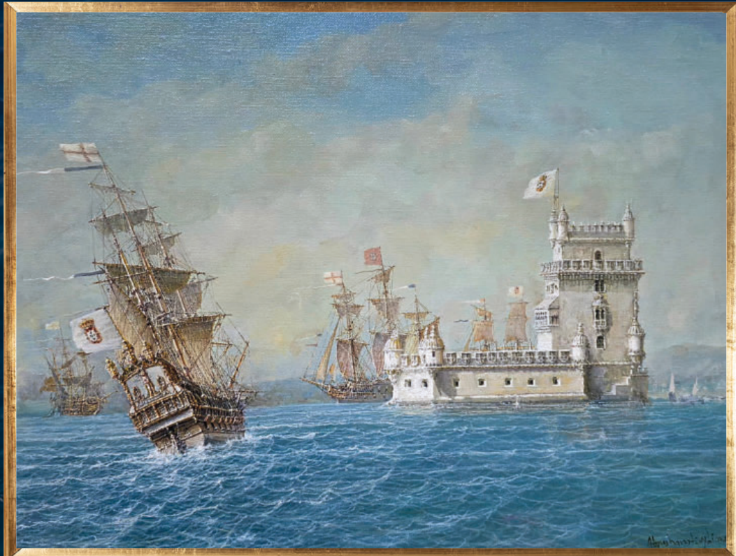
Óleo sobre tela de algodão 40 x 50 cm | Artista Plástico Abraham Levy Lima