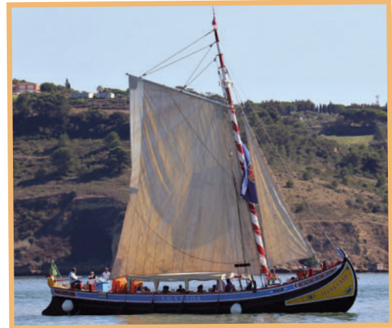
Varino Liberdade, da Câmara Municipal de Vila Franca de Xira