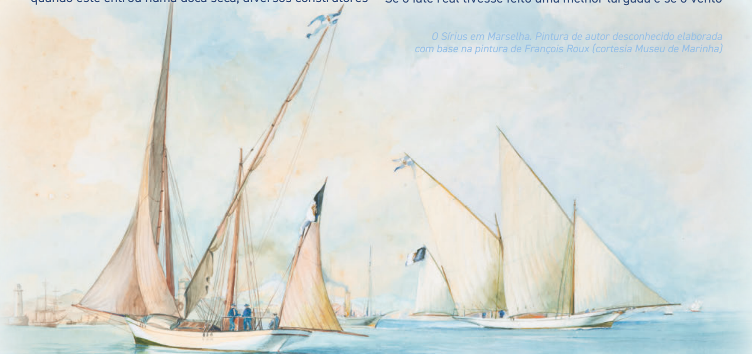
O Sírius em Marselha. Pintura de autor desconhecido elaborada com base na pintura de François Roux

Nesse mesmo ano dois dos melhores iates ingleses, o Cetonia e o Gestrude , vieram a Lisboa para competir com o iate real. A 21 de outubro, a Real Associação Naval organizou a primeira regata internacional em Portugal. Com largada de Paço d'Arcos, ficando uma das balizas situada em Olho de Boi, em Almada e outra em Oeiras, a prova consistia em dar três voltas ao circuito, findando a corrida em Belém. Para além do Sírius as cores nacionais foram representadas pelo Altair , Alcyon , Mina e Orion . Chegaram em primeiro lugar o Cetonia e o Gestrude , em terceiro lugar o Altair , depois o Sírius e finalmente o Alcyon , o Mina e o Orion . Depois de deduzidos os abonos, o Cetonia ficou em primeiro, seguido do Altair , Gestrude e Sírius . Este mau resultado não é prova de que o Sírius não tivesse boas qualidades náuticas. Neste dia, o tempo estava chuvoso e com vento fresco de sul, obrigando a que todos os veleiros fizessem a prova com pano rizado. Esta situação prejudicou os veleiros portugueses que armavam em caíque, que com as velas rizadas perdiam qualidades náuticas, comparativamente a armação em palhaborde do Cetonia e em iole do Gestrude . Se o iate real tivesse feito uma melhor largada e se o vento