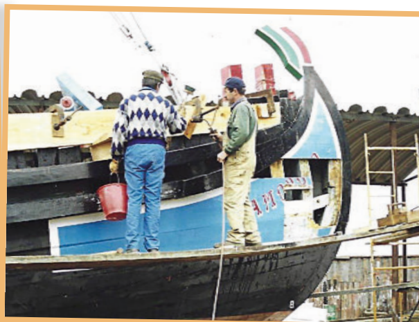
Reparação do varino Amoroso