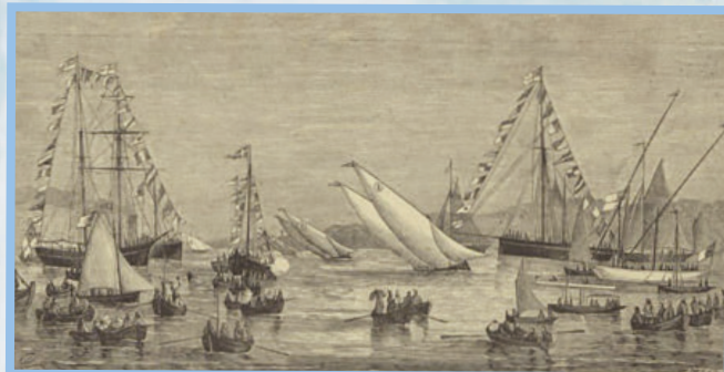
Regata de 1878 na Rocha do Conde d'Óbidos

navais quiseram analisá-lo detalhadamente. Durante a sua estadia em Marselha, o caíque causou tão boa impressão que teve o privilégio de ser retratado pelo famoso pintor de marinha francês François Geoffroy Roux. Largando a 17 de abril, chegou a Lisboa em 24 de maio, tocando os portos de Barcelona, Dénia, Gibraltar, Cádiz e Faro.